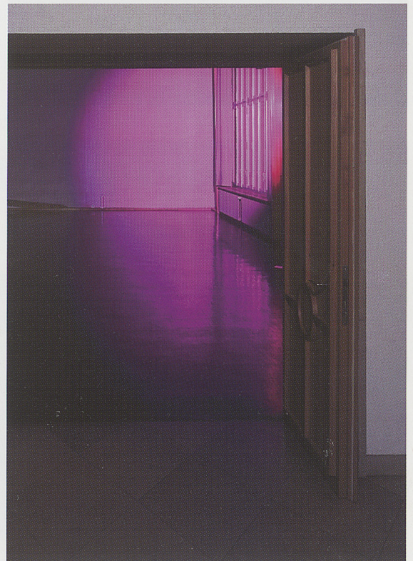
Katharina Grosse, «Liturgische Farben», 2001. Lichtinstallation mit Jakerb Bug 400 ETC Scheinwerfer, 6 x 15 x 6 m. Blick vom Vestibül in den Gottesdienstraum.

Dank einer nachträglichen anonymen Spende, mit der schliesslich die gesamte künstlerische Neugestaltung des Gemeindehauses Stephanus finanziert wurde, konnte noch ein zweiter Wettbewerb organisiert werden. Diesmal lautete die Aufgabe, die wechselnden Farben der Kirchenjahreszeiten zur Darstellung zu bringen, ein Thema, dem sich in jüngster Zeit immer mehr reformierte Kirchengemeinden öffnen. Während traditionellerweise die liturgischen Farben ihren Ort in der Paramentik, das heisst in den liturgischen Gewändern oder im textilen Schmuck von Kanzel oder Abendmahlstisch haben, wollte man im Stephanus das Thema mit einer farbigen Gestaltung der Fenster verbinden.