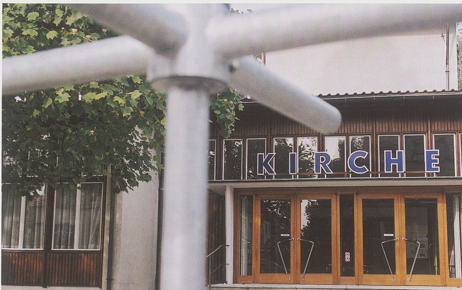
Markus Müllers Vorplatz-Neugestaltung mit Drehkreuz und Leuchtschrift (Kirche), 2002.

Ein zweites Anliegen der Neugestaltung war es, den Platz stärker als Kirchenvorplatz erkennbar zu machen. Am Rande des Platzes, dem Haupteingang gegenüber, steht ein grosses Drehkreuz, das so aufgestellt ist, dass es den Passanten nicht zwingt, durch es hindurch zu gehen. Es soll als Symbol gelesen werden und weckt denn auch vielfältige Assoziationen. Zunächst denkt man an Drehkreuze, wie man sie von Viehweiden kennt. Das Motiv zeichnet den Platz und mit ihm die Kirche als Weideplatz aus, als Ort, wo der Pastor, der Hirte der Kirche, seine Schafe, die Herde Jesu, weidet.